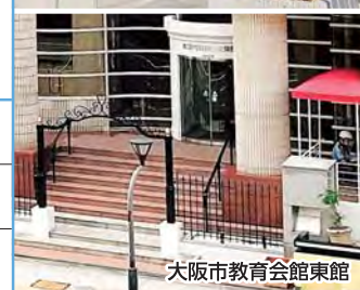
大阪市教育会館東館