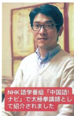
NHK 語学番組「中国語！ ナビ」で太極拳講師として 紹介されました

お問合せ 大阪市教育会館 住所：中央区法門坂1-1-18 TEL:06-6941-0951 FAX:06-6941-7474 E-mail:kaikan@zaidan.or.jp