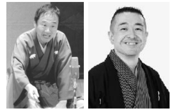
ゲスト 笑福亭鶴笑 桂文三

申込方法 下記宛先まで郵送・FAX 等にてお申し込み下さい。予約が成立した方には、振込口座番号・振込期限を記載した予約確認書を送付いたします。複数でお申込の場合は申込書に代表者名を明記してください。予約確認書は 1 グループ 1 枚の発行となります。前売券のキャンセルは受付ませんのでご了承下さい。