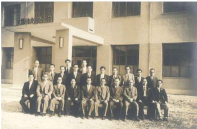
旧教員会館(旧教員会館を背景に設立時の役員)

思い出深い写真で、教員会館とパル法円坂・アネックスパル法円坂、さらには、法円坂の歴史を振り返ってみました。懐かしさに触れながらごゆっくりお楽しみください。