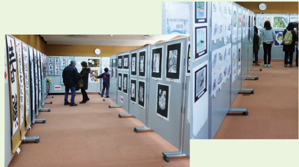
児童生徒作品展を参観する