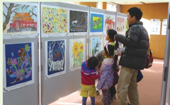
児童生徒作品展を参観する 児童と保護者(2017年2月)

後援 大阪市教育委員会(予定) 大阪市小学校教育研究会(図画工作部会) 大阪市小学校教育研究会(国語部書写委員会) 大阪市立中学校教育研究会(美術部) 大阪市立中学校教育研究会(国語部)