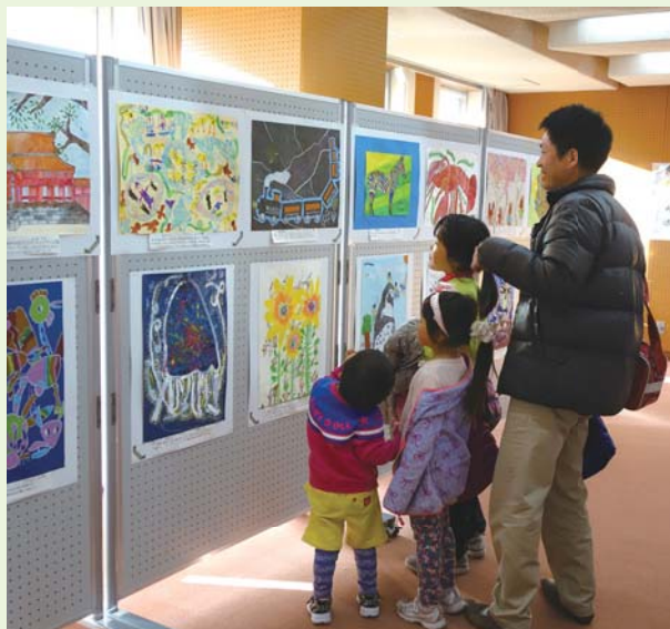
▲児童生徒作品展を参観する児童と保護者(2017年2月)