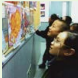
▲上海市愛菊小学校で展示された大阪の子どもの作品(2013年3月)