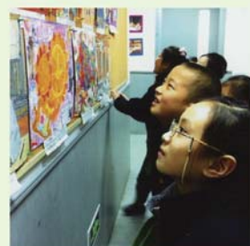
▲上海市愛菊小学校で展示された大阪の子どもの作品(2013年3月)

会場 アネックス パル法円坂(大阪市教育会館) B棟3階市民ギャラリー 展示期間 通年 (アネックスパル法円坂休館日を除く) 開設時間 午前9時30分～午後5時30分