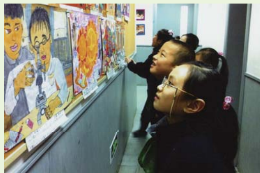
▲上海市愛菊小学校で展示された大阪の子どもたちの作品。 (2013年3月)