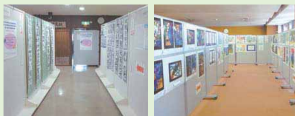
▲写真は昨年の児童・生徒作品展